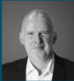
Dirk Paczia Beratung