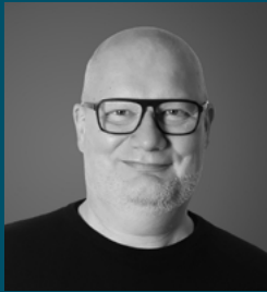
Volker Markmiller Beratung